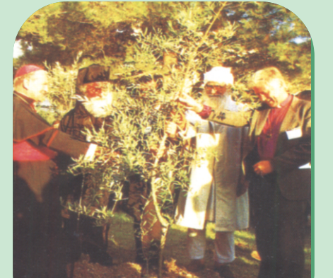
मौलाना वहीदुद्दीन खान, डावीकडून तिसरे, १९९५ सालच्या जेरूसलेम येथील सर्वधर्मीय शांती परिषदेत ऑलीव्हचे झाड लावताना.

शांतीचे समर्थन आणि परस्पर विश्वासाच्या हेतूंचा स्वीकार यामुळे ते सर्वत्र आदरणीय ठरले. शांतीचे हे जीवनकार्य तेवते ठेवण्यासाठी मौलाना वहीदुद्दीन खान यांनी २००१ साली नवी दिल्ली येथे शांती आणि अध्यात्म केंद्र (सेंटर फॉर पीस अँड स्पिरिच्युअॅलिटी, सीपीएस) स्थापन केले. संघटनेच्या या नावावरून स्पष्ट होते की, मनात लपलेल्या आध्यात्मिकतेला साद